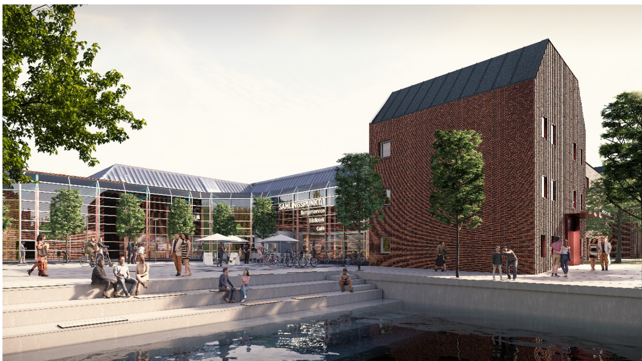
1 Huset set fra Rådhusstorvet, Hotellet får indgang mod vest, til højre på visualiseringen. (AART Architects)